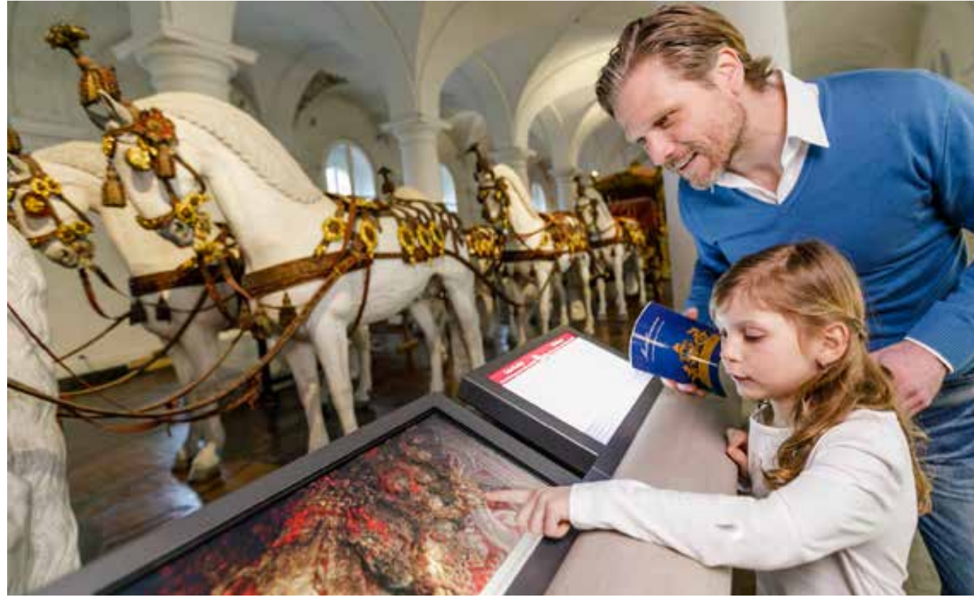
Glyptothek Marstallmuseum