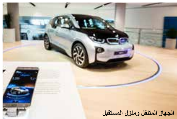
الجهاز المتنقل ومنزل المستقبل

فرض حظر على صناعة الطائرات الحربية ومحركاتها في ألمانيا بسبب معاهدة فرساي، فبدأت الشركة في صناعة الدراجات النارية ثم قررت دخول عالم صناعة السيارات بسياراتها الأولى سيارة بي ام دبليو ٣١٥.