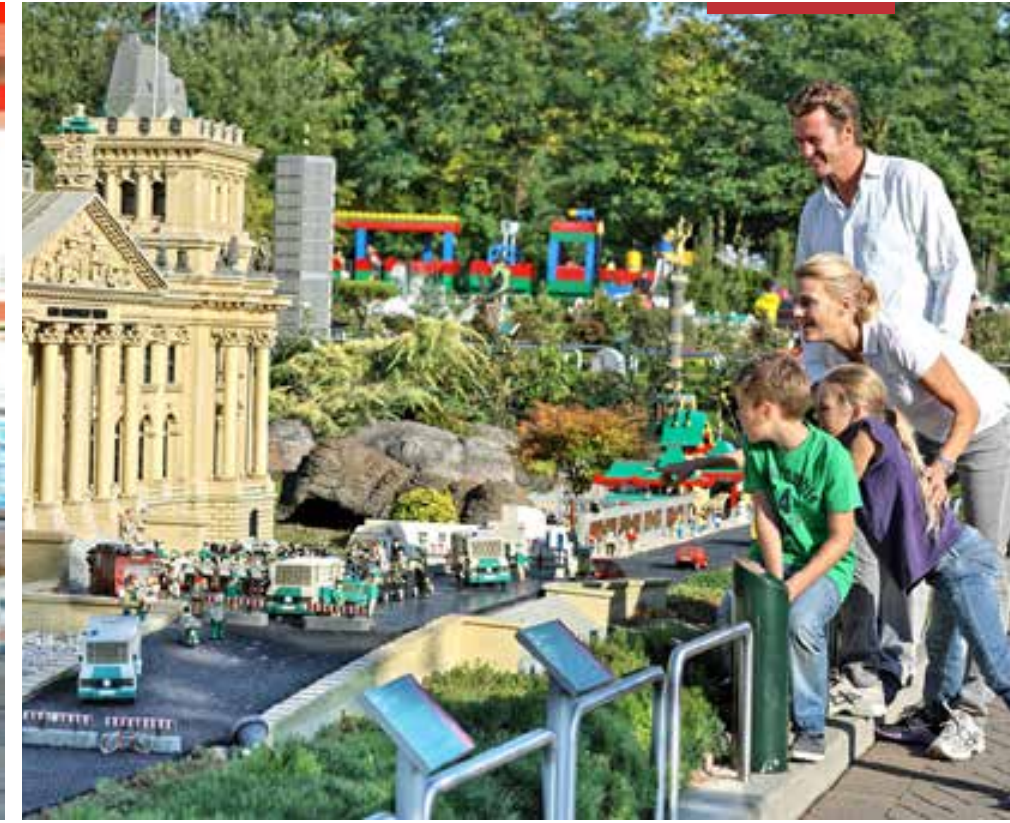
العوالم الجذابة في ليجو لاند

الأحداث والإثارة. ومن أحب أن يقضي ليلته كفارس أو أميرة يمكنه ابتداءا من موسم ٢٠١٣ أن يبيت في قرية الإجازات ويختار أحد ٣٤ غرفة خلابة في القلعة الجديدة في ليجولاند صنفت حسب المواضيع المختلفة.