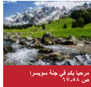
مرحبا بكم في جنة سويسرا ص ٥٨-٦٧