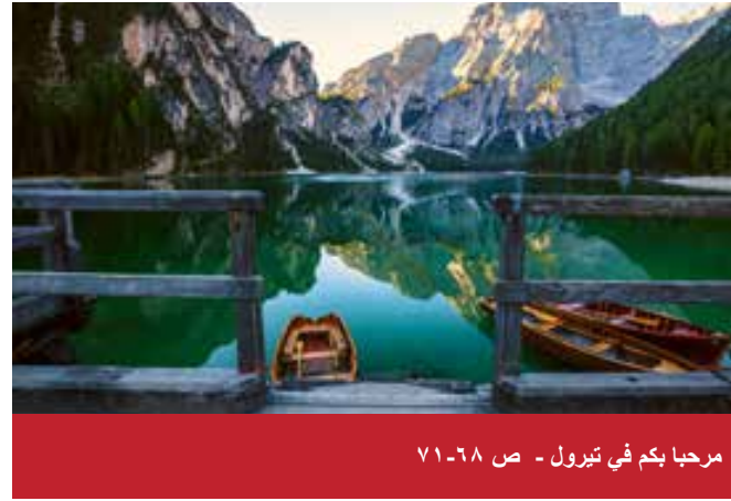
مرحبا بكم في تيرول - ص ٦٨-٧١

CityDent Munich Praxis für Zahnheilkunde Zahnarzt Msc Adnan Darwish Bayerstrasse 27 80335 Munich - Germany هاتف: +49 (0) 89 593 575 فاكس: +49 (0) 89 545 40 786 البريد الإلكتروني: info@citydent-munich.com www.citydent-munich.com