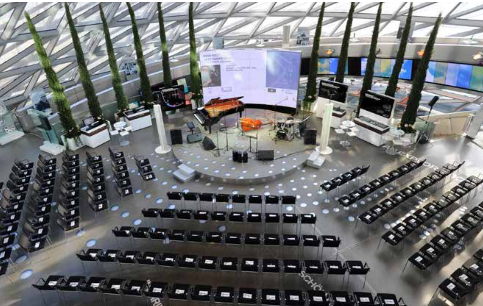
ناهيك عن وفرة من منتجات الحياة العصرية واللوازم كصندوق الحمالة