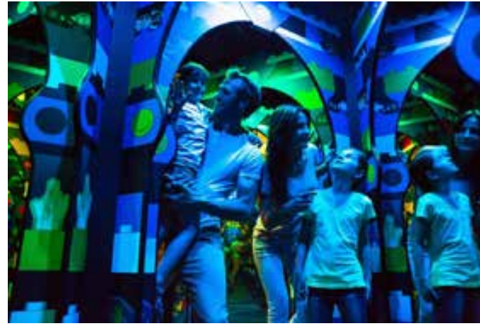
تقدم الحديقة إمكانات جذابة لتقضي كافة أفراد العائلة ليلة ممتعة باكملها