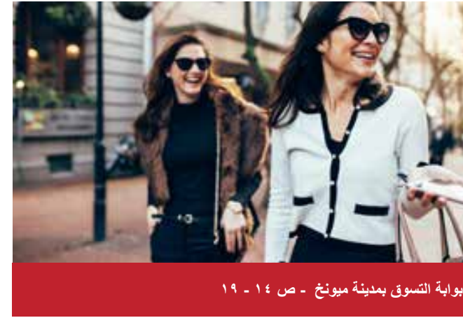
بوابة التسوق بمدينة ميونخ - ص ١٤ - ١٩

قاموس، هواتف هامة، الطوارئ، المواصلات العامة: الباص، القطار، قطار الأنفاق، قطار الجسور، التاكسي، قطار المترو، حركة مطار ميونخ، إجراءات التأشيرة، مواعيد الإفتتاح، القياسات والأوزان والأبعاد، العملات، ماستر كارد، فيزا كارت، أميريكان اكسبرس، الطقس والمناخ، www.oanda.com الخرائط والرسوم، الأكل والشرب، المساجد، أوقات الصلاة، معلومات سياحية، السيارات والدراجات النارية، المتاحف، التأشيرات، جواز السفر، الرسوم، قيادة السيارات في ألمانيا، الصيدليات، المتاحف، بيانات الناشر وغيرها.