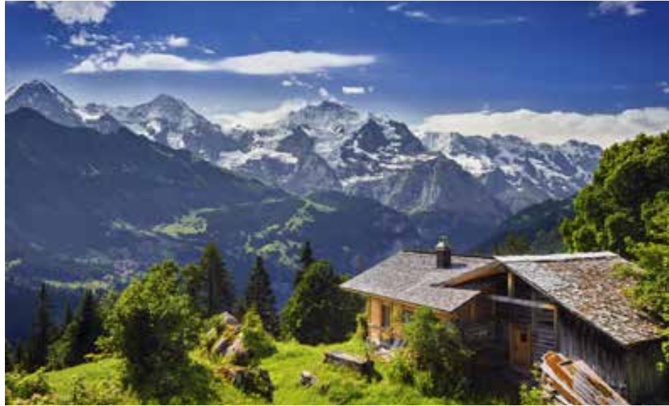
لا تنسى ، أكواخ جبلية مذهلة ترحب بكم

... أن سويسرا أصبحت على نحو متزايد الوجهة المثالية للسياحة الصحية.