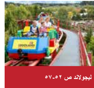
ليجولاند ص ٥٢-٥٧