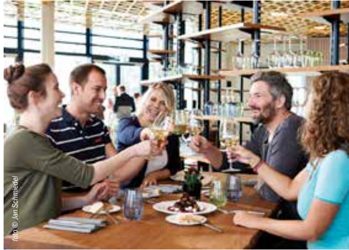
استمتعوا بمطبخ شفايتسر مع مأكولات صحية وطازجة وموسمية

الطيران والتزلج والتسلق والإحتفال والطعام الشهى - كل ذلك تقدمه ملاعب يوخن شفايتسر