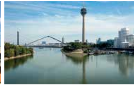
الفرع كونراديا: ميونيخ، هامبورغ، برلين، دوسلدورف