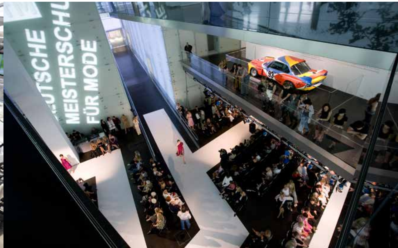
بي أم دبليو الجديدة من الفئة السابعة تجمع بين الإحكام التقني والخطوط الشعرية والواجهات

تقنيات ووسائل إعلام جديدة تضمن متعة شاملة متعددة الوسائط وتداخلية في آن واحد