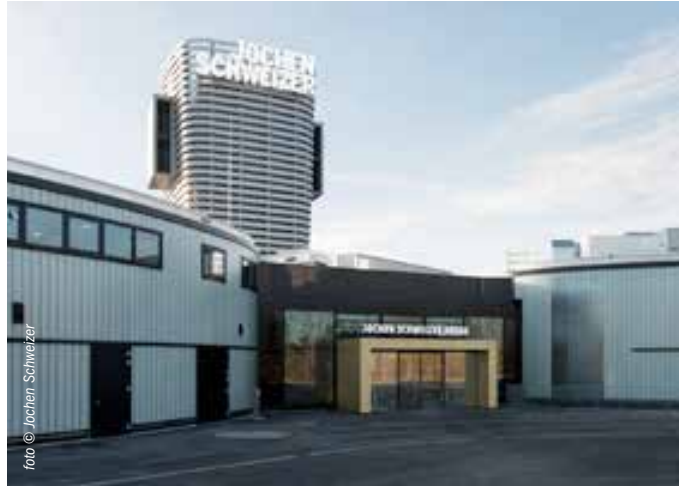
أرينا يوخن شفايتسر الرائعة في تاوف كيرشن بالقرب من ميونخ