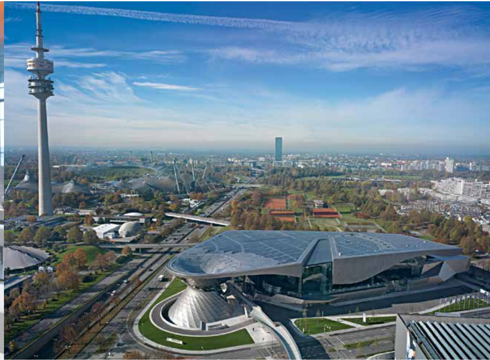
متحف بي أم دبليو BMW