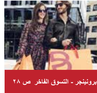
برونيونجر - التسوق الفاخر ص ٢٨