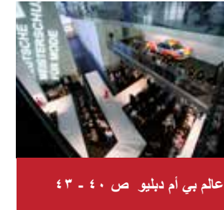
عالم بي أم دبليو ص ٤٠ - ٤٣