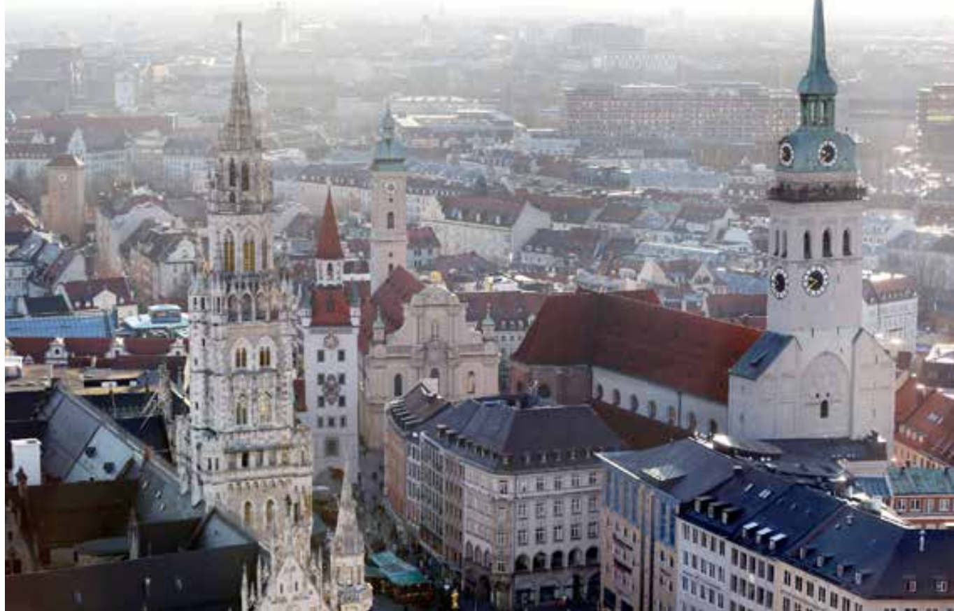
Muenchner Marienplatz