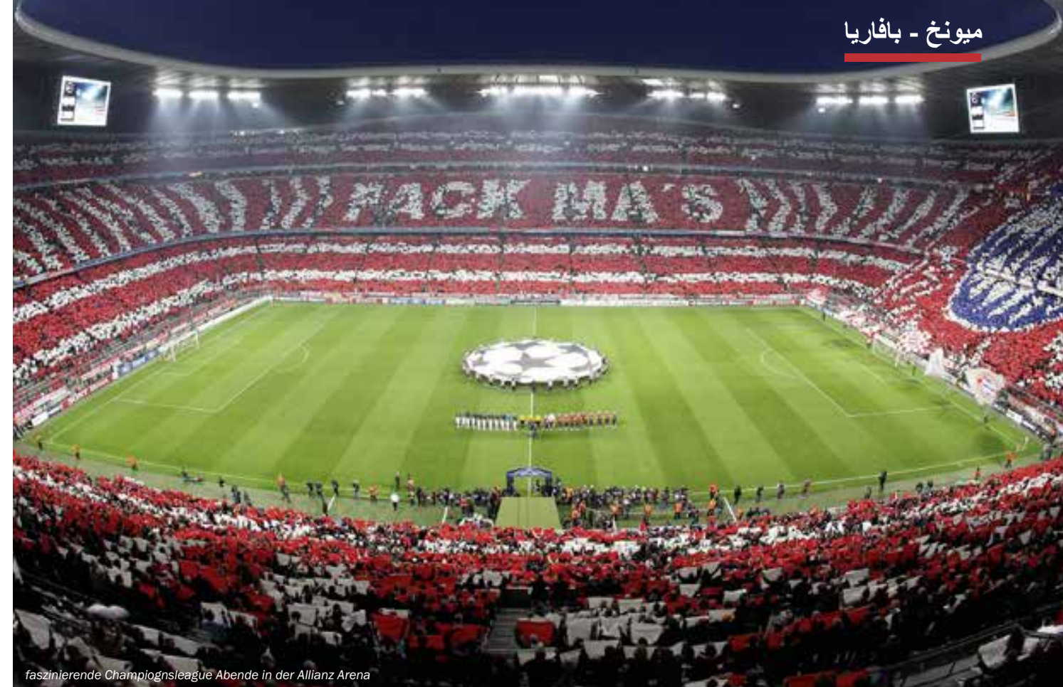
faszinierende Championsleague Abende in der Allianz Arena