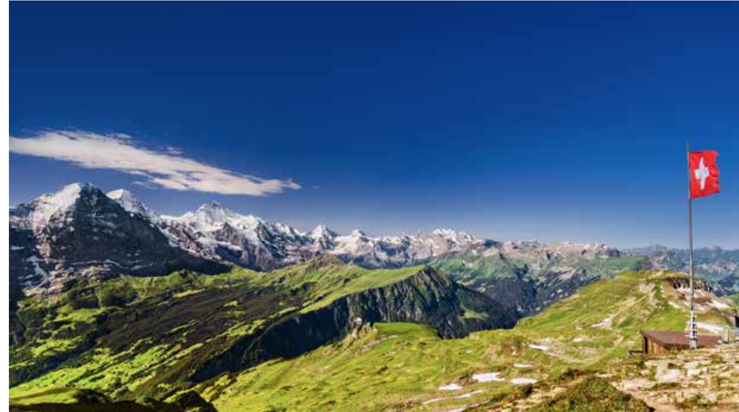
باتوراما لا تنسى - مرحباً بكم في جنة سويسرا

... أن سويسرا أصبحت على نحو متزايد الوجهة المثالية للسياحة الصحية.