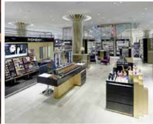
استمتع بالتسوق الفاخر برونينجر - Breuninger الفريد في دوسلدورف

الشاملة من قبل Beauty Rooms. وفي أماكن خاصة يوفر خبراء التجميل الهدوء والاسترخاء مع المنتجات الحصرية.