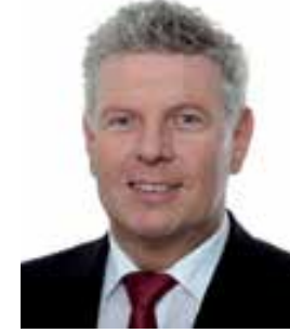
ديتر رايتير رئيس بلدية مدينة ميونخ

وبعد جولة سياحية عبر المدينة توفر مطاعم ميونخ المتنوعة في أطباقها