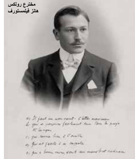
مخترع رولكس هانز فيلمستورف