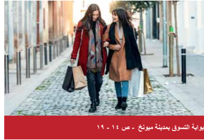
بوابة التسوق بمدينة ميونخ - ص ١٤ - ١٩

قاموس، هواتف هامة، الطواريء، المواصلات العامة: الباص، القطار، قطار الأنفاق، قطار الجسور، التاكسي، قطار المترو، حركة مطار ميونخ، إجراءات التأشيرة، مواعيد الإفتتاح، القياسات والأوزان والأبعاد، العملات، ماستر كارد، فيزا كارت، أميريكان اكسبرس، الطقس والمناخ، www.oanda.com الخرائط والرسوم، الأكل والشرب، المساجد، أوقات الصلاة، معلومات سياحية، السيارات والدراجات النارية، المتاحف، التأشيرات، جواز السفر، الرسوم، قيادة السيارات في ألمانيا، الصيدليات، المتاحف، بيانات الناشر وغيرها.