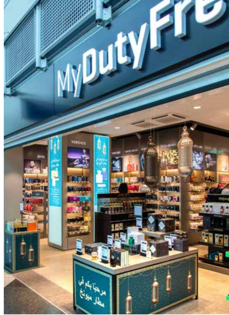
... لتقديم المجموعة الحصرية لك شخصياً