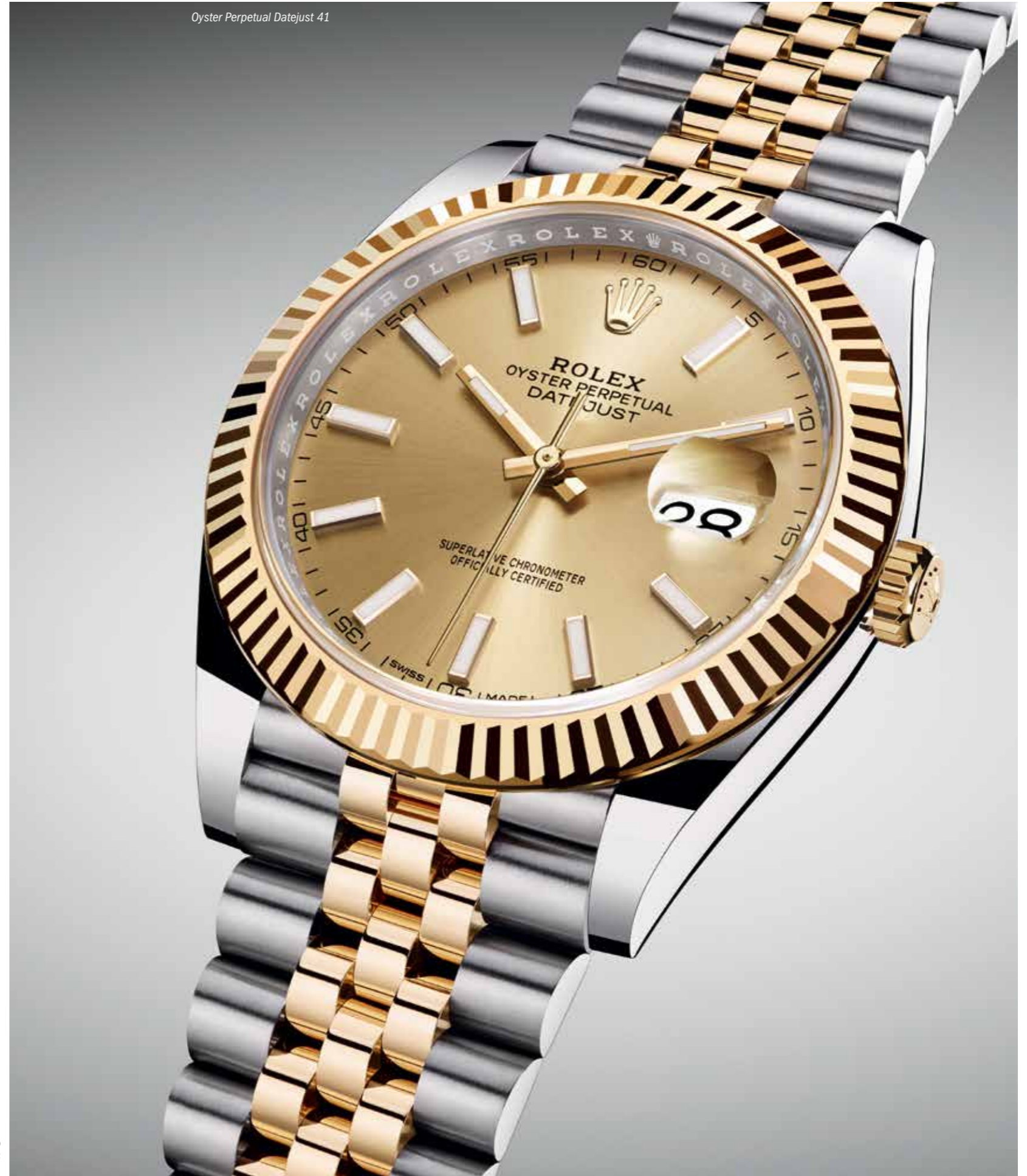
Oyster Perpetual Datejust 41

OYSTER PERPETUAL LADY-DATEJUST 28 ليدي ديت جست ٢٨ رولزور- يتوفر الجيل الجديد من أويستر بيربييتوال ليدي ديت جست في OYSTER PERPETUAL LADY-DATEJUST في إصدارات رولزور أصفر و رولزور إيفيروس. تمتاز هذه الإصدارات بهيكل أكبر سمكه ٢٨ مم