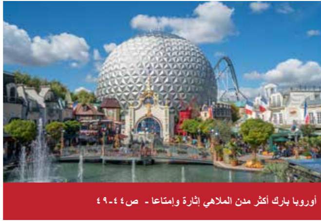
أوروبا بارك أكثر مدن الملاهي إثارة وإمتاعا - ص ٤٤-٤٩

CityDent Munich Praxis für Zahnheilkunde Zahnarzt Msc Adnan Darwish Bayerstrasse 27 80335 Munich - Germany هاتف: +49 (0) 89 593 575 فاكس: +49 (0) 89 545 40 786 البريد الإلكتروني: info@citydent-munich.com www.citydent-munich.com