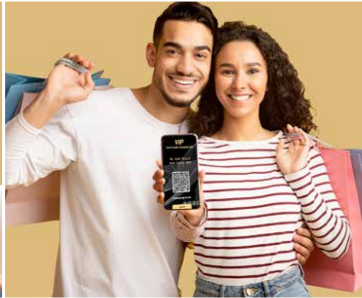
بطاقة المسافر العربي VIP للتسوق الخاصة بك!