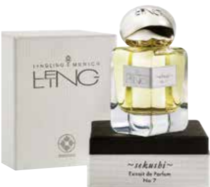
LENGLING Flakon مع Box Nr 7 والعلامة التجارية السويسرية الفاخرة Gisada

نحن نقدم استشارات لاختيار المنتجات خلال.