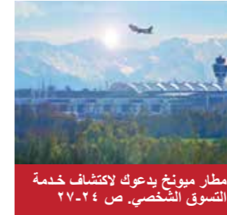
مطار ميونخ يدعوك لاكتشاف خدمة التسوق الشخصي. ص ٢٤-٢٧