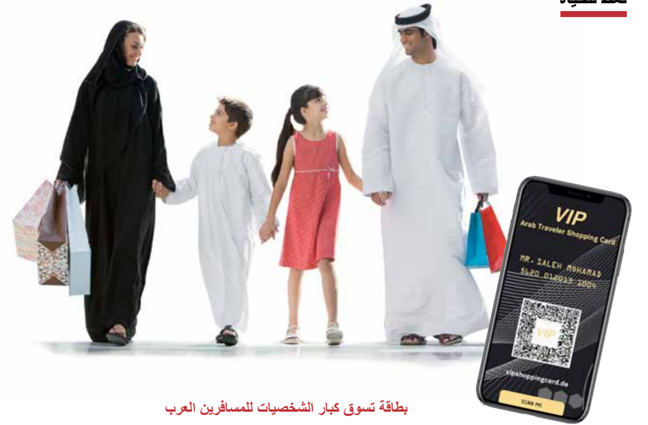
بطاقة تسوق كبار الشخصيات للمسافرين العرب