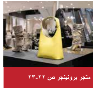
متجر برونيجر ص ٢٢-٢٣