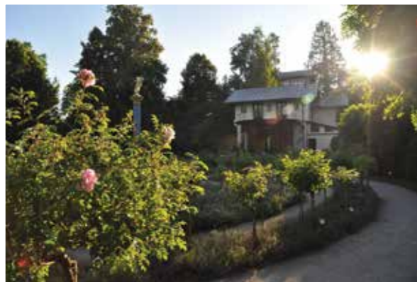
إلى الشمال: أشهر قصر في بحيرة شتارن بيرجر زي. وهنا في المقر العائلي قضت قيصر النمسا إيزابيت (يدعوها سيزي) أيام شبابها.

بماريا العروج في القسم الشرقي آف كيرشن والتي كانت تستقطب الحجاج المسيحيين في القرن السادس عشر.