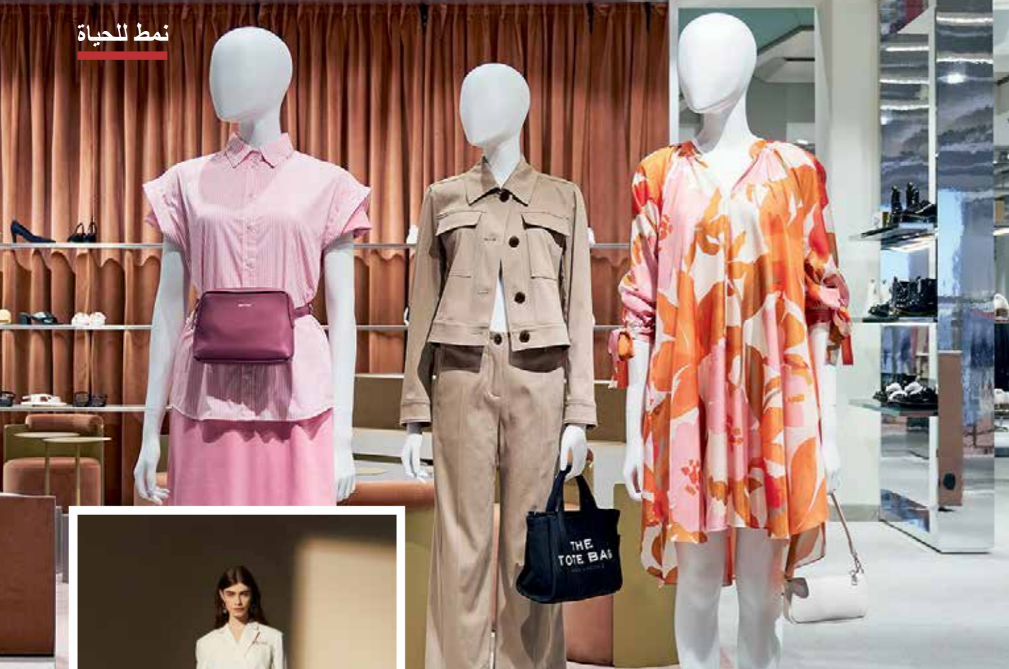
ياخذ متجر برونينجر عمله كعلائمه التقليدية وخبرته في هذا المجال على مدى عقود عديدة إلى عالم الموضة الرابع مع تقديم الإلهام وخلق لحظات سعيدة.