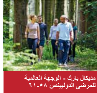
مديكال بارك - الوجهة العالمية للمرضى الدوليين ص ٥٨-٦١