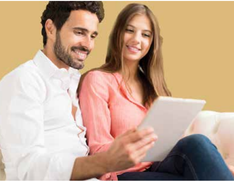
لقد حصل شركاؤنا على مفاجأة رائعة لك!