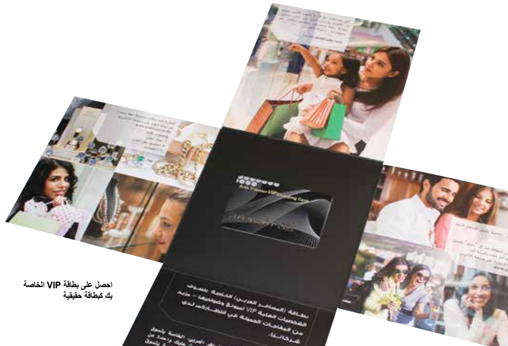
احصل على بطاقة VIP الخاصة بك كبطاقة حقيقية

الآن ببساطة ابدأ واستفيد من المزايا العديدة مع بطاقة تسوق المسافر العربي. يمكنك قراءة معلومات حول التقديم والاستخدام الأمثل لبطاقة تسوق المسافر العربي VIP