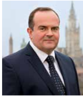
كليمنس باومغارتنر رئيس قسم العمل والاقتصاد