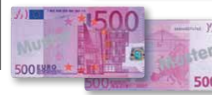
خمسة مائة يورو