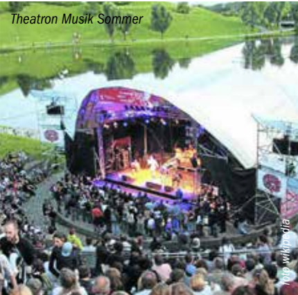
Theatron Musik Sommer