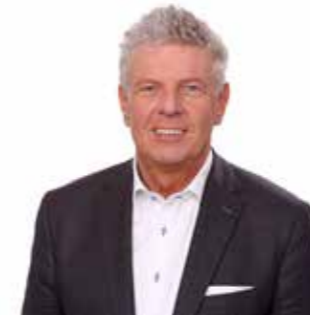
ديتر رايتير رئيس بلدية مدينة ميونخ

تقدم عاصمة ولاية بافاريا كل ما تتمناه بأعلى مستويات الجودة. خدمة التوجه، المناخ المعتدل، الفن والثقافة، وقت الفراغ الممتع للعائلات، المحلات التجارية الحصرية، أفضل رعاية طبية، مجموعة كبيرة من فنادق ٤-٥ نجوم، مطاعم لكل ذوق، العديد من الحدائق الخضراء والحدائق والمسافات القصيرة الممتعة.