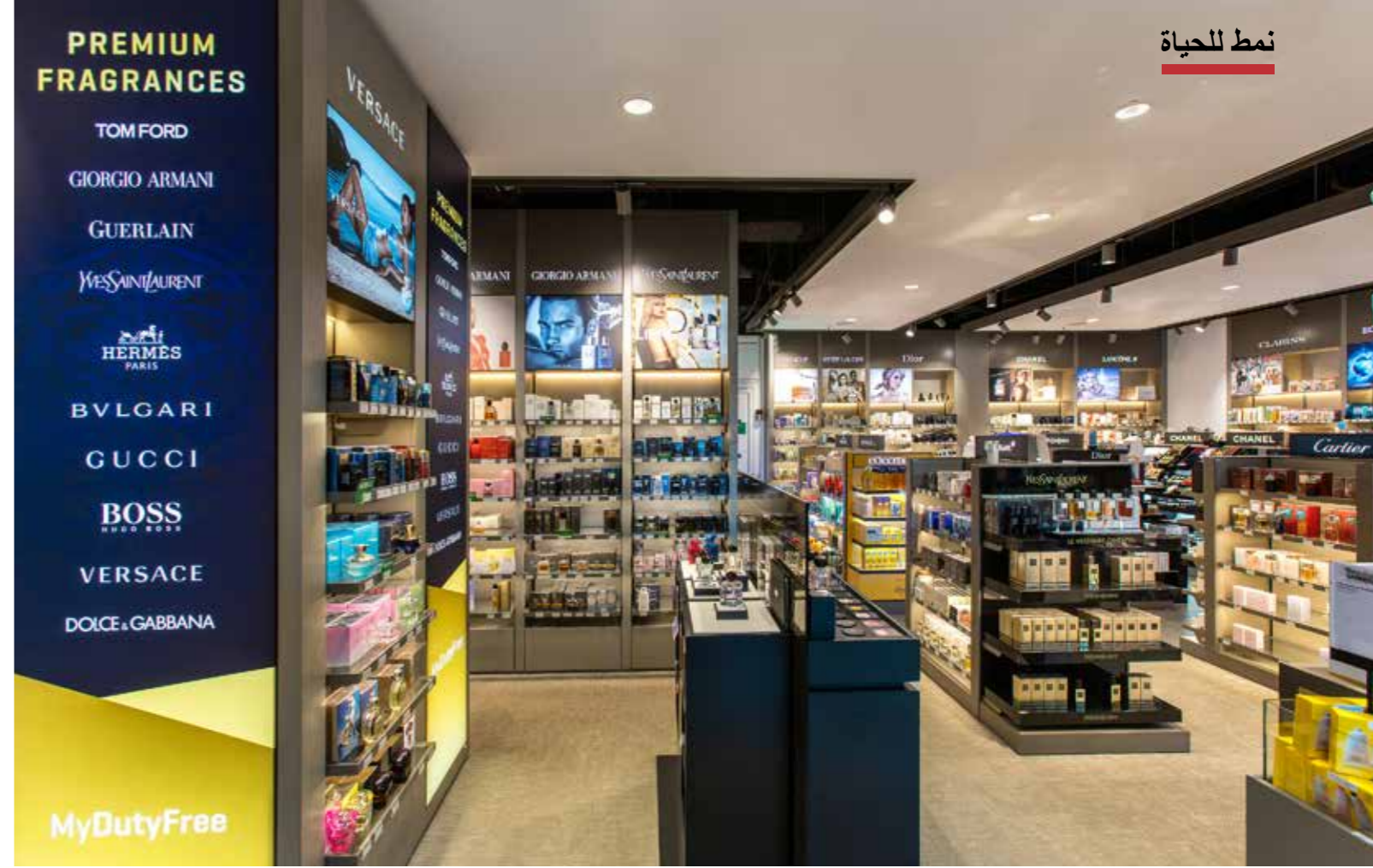
يسعدنا مرافقتك من خلال متاجر MyDutyFree في مطار ميونخ ...