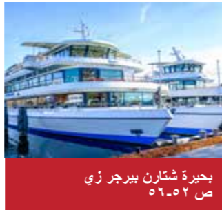
بحيرة شتارن بيرجر زي ص ٥٢-٥٦