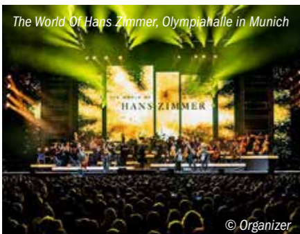
The World Of Hans Zimmer, Olympiahalle in Munich