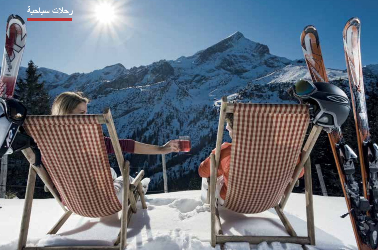
في البدء تلالو قمة الجبل، ثم ينسحب السحر إلى اليابسة. لقد حان موسم التزلج وخفقان القلب