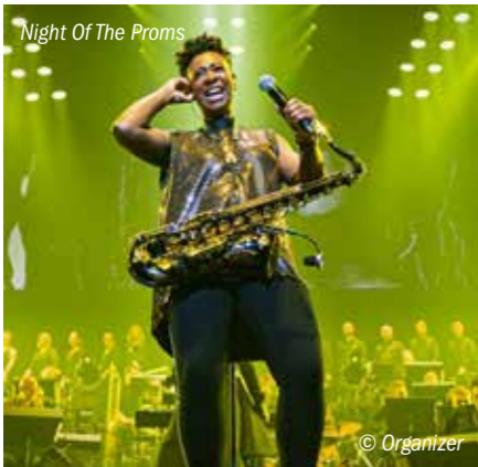
Night Of The Proms