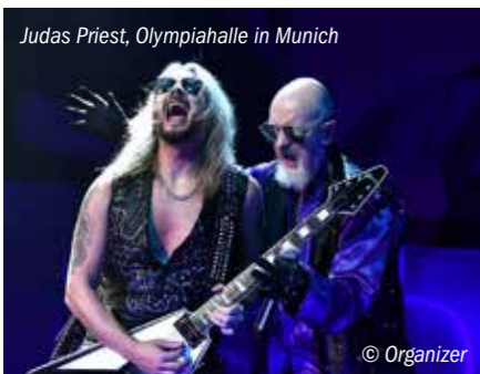
Judas Priest, Olympiahalle in Munich