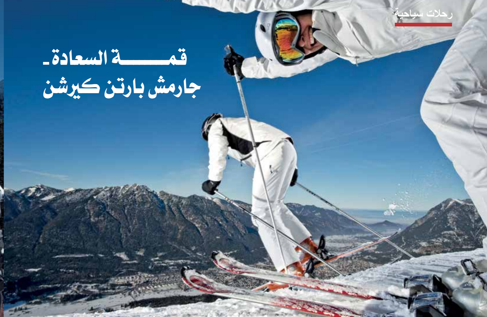
جارمش كلاسيك: ٦٠ كم من المنحدرات وأحدث المصاعد ومنطلقات في مختلف درجات الصعوبة. وأعلى منطقة تزلج في ألمانيا

تمتلك بافاريا العليا ٤٠٠ كيلومترا من المنحدرات و ٢٦٠ مصعدا. وتعتبر هذه المناطق الأربعة محبوبة لعشاق الرياضة الشتوية