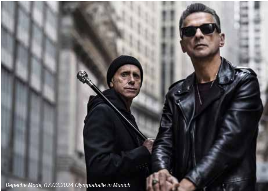
Depeche Mode, 07.03.2024 Olympiahalle in Munich