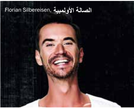
الصالة الأولمبية، Florian Silbereisen.

في الأونة الأخيرة، كانت الفرقة بنجمها شنيفاني كلوس على موعد مع أول ألبوم لها شخصي الإنتاج "Leichtes Gepäck" - لايشنيس كيبب". الآن وتستمر الرحلة لتجر معها زيلبرموند مرة أخرى على إلى خشبات المسارح الكبرى في البلد السبت ٢٠/٢/٨، الساعة الثامنة مساءً، الصالة الأولمبية - أولومبيا هاليه.