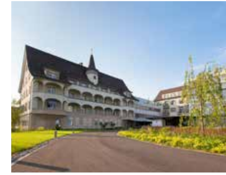
مستشفى بيتانيين الخاص في زيورخ klinikbethanien.ch

يقع المستشفى في أفضل موقع مرتفع مع إطلالة على البحيرة. مع وجود ٢٥٠ من الأطباء المحالين، يقدم المستشفى الراسخ مجموعة من الخدمات الطبية القائمة على أحدث التقنيات وطرق العلاج.