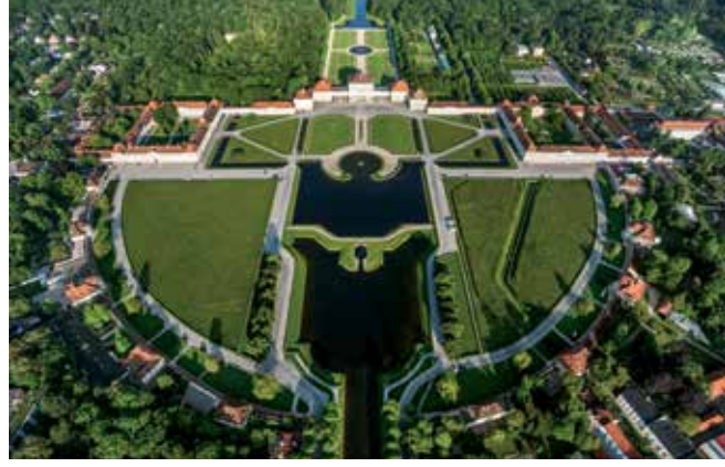
Der Neue Blick auf München

مشاهير الأزياء العصرية بعروض وأسعار مغرية لا تجدونها في المحلات التجارية الكبرى. وفي هذا الخصوص تقدم لكم مجلة السائح العربي خدمة مميزة عبر بطاقتها الممتازة للتسوق التي تمكنكم من شراء حاجياتكم بأسعار مخفضة.