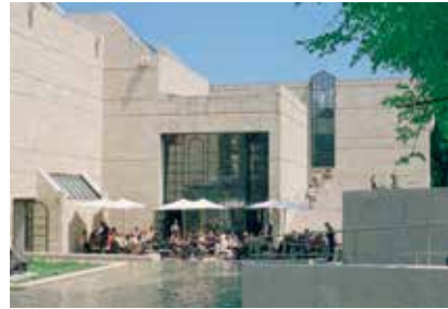
معروض الرسومات واللوحات القديمة

فان غوخ ومونيت وفون شيبينغ. ورغم اختلاف وتنوع هؤلاء الفنانين إلا أن كل عمل من أعمالهم يمثل حقبة فنية في القرن التاسع عشر. اجتمعت جميع أعمالهم تحت قبة معروض الرسومات واللوحات القديمة. إنها فرصة لا تعوض لعاشقي الفن الرائع والأصيل.