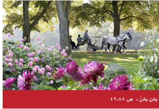
بادن بادن - ص ٤٨-٤٩

CityDent Munich Praxis für Zahnheilkunde Zahnarzt Msc Adnan Darwish Bayerstrasse 27 80335 Munich - Germany هاتف: +49 (0) 89 593 575 فاكس: +49 (0) 89 545 40 786 البريد الإلكتروني: info@citydent-munich.com www.citydent-munich.com