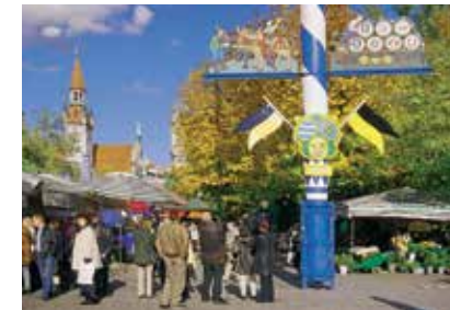
سوق المواد الغذائية

يعتبر سوق المواد الغذائية من أجمل المواقع التي تعتبر من خصوصيات مدينة ميونخ. كما أن أمهر الطهاة في أفخر المطاعم يفدون إلى هذا السوق ويشترون المكونات الطازجة لوجباتهم اللذيذة.