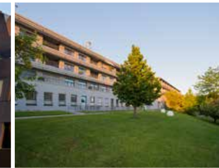
مستشفى ليندبيرغ الخاص في فينترتور lindberg.ch

حقق المستشفى اسماً لنفسه في المجالات التالية: الجراحة التجميلية والترميمية وجراحة سرطان الثدي وجراحة الوجه والفكين وجراحة المفاصل والرياضة والجراحة الوريدية وجراحة اليد والقدم وجراحة العيون.