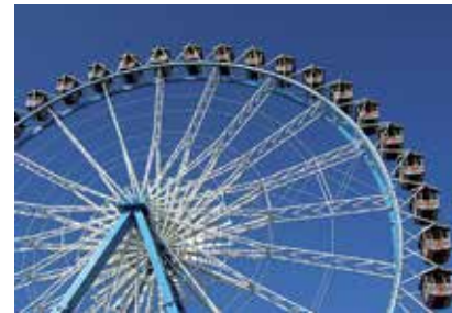
مهرجان أكتوبر الشعبي

تم بناؤه خصيصاً للألعاب الأولمبية في عام ١٩٧٢ وهو لا يزال أحد أهم وأشهر معالم المدينة ومراكز التلصية حتى يومنا هذا بما يتميز به من أسلوب معماري يطغى عليه الزجاج. وهناك الكثير من الفعاليات المثيرة التي تقام في الإستاد أو الصالة الأولمبية أو في المنتزه وتجذب أعداداً كبيرة من المتفرجين.