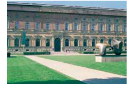
المعرض الفني القديم للرسوم واللوحات

يكفي للمعمار بمفرده أن يكون مدعاة لزيارة المبنى. حيث يقام فيه معارض متعددة ومتنوعة والتي تضم لوحات ومعارض فنية تعود إلى القرنين ٢٠ و ٢١. ولهواة التحف والقطع النادرة الراقية فإن زيارة قسم التحف والتصاميم ستكون مجدبة بالتأكيد.