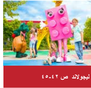
ليجولاند ص ٤٢-٥٥