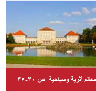
معالم أثرية وسياحية ص ٣٠-٣٥