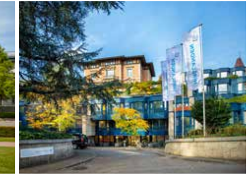
مستشفى هيرسلاندين إم بارك في زيورخ hirslanden.com

بإحتوائه على أكثر من ٥٠ معهداً ومركز كفاءة طبية، يعد مستشفى هيرسلاندين شركة رائدة في مجال الرعاية الصحية تتمتع بخبرة لا مثيل لها. ينصب التركيز على أمراض القلب والجراحة الحشوية وعلم الأعصاب وجراحة العظام وأمراض النساء والتوليد.