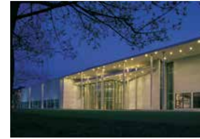
المعرض الفني الحديث للرسوم واللوحات

كان ملوك الفيلسباخ يحكمون من مقر إقامتهم إبان العهد الملكي. أما اليوم فتتم الاستفادة من المبنى بطرق كثيرة. ففي قاعة هرقل تقام بانتظام كثير من الحفلات، أما المتحف الحكومي للفنون المصرية فهو مودع في حجرات المقر.