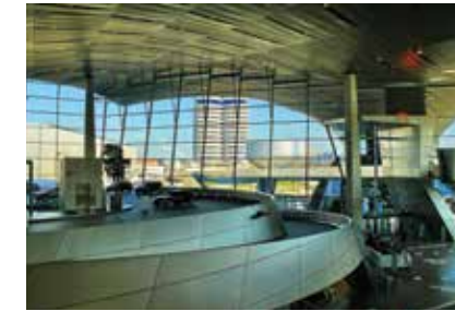
عالم سيارات الـ BMW

الكاتدرائية التي كرسست للمرأة المنكورة في أقوالنا وأساطيرنا الشعبية هي من أبرز المعالم السياحية والأثرية في ميونخ. وبذلك فإن ما يعرف «ببرجي البصل» اللذان يشمخان فوق الكاتدرائية ذات الطراز المعماري الغوطي يكملان صورة المدينة. ويتيح البرج الجنوبي للزائرين نظرة شاملة ورائعة لمدينة ميونخ.