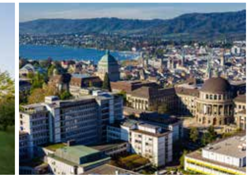
مستشفى زيورخ الجامعي في زيورخ usz-international.com

يقع المستشفى على سفوح ليندبيرج في فينترتور. تشمل التخصصات الطبية الرئيسية الجراحة العامة وجراحة العظام والصدمات العضلية الهيكلية وأمراض الكلى وغسيل الكلى والجراحة الحشوية والمسالك البولية.