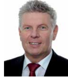
ديتر رايتير رئيس بلدية مدينة ميونخ