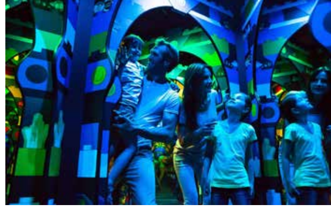
تقدم الحديقة إمكانيات جذابة لتقضي كافة أفراد العائلة ليلة ممتعة بأكملها