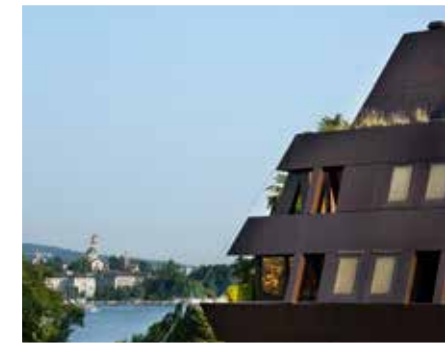
مستشفى بيراميدا أم زيه في زيورخ pyramide.ch

تشمل الاختصاصات الرئيسية في المستشفى ما يلي: أمراض القلب وجراحة الأوعية الدموية القلبية والصدرية وجراحة الأحشاء وجراحة العظام والصدمات والجراحة الرياضية وأمراض النساء والتوليد والأشعة وعلم الأشعة العصبية وعلم الأورام وجراحة الأعصاب والمسالك البولية.