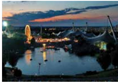
أولمبيا بارك - المنتزه الأولمبي

يحتضن هذا المبنى المثير الكائن في ماكس جوزيف بلاتز في ميونخ دار الأوبرا البافارية ودار الباليه القومية. غالباً ما تكون العروض قد بيعت مسبقاً، بحيث أنه يُنصح بالحجز مسبقاً.