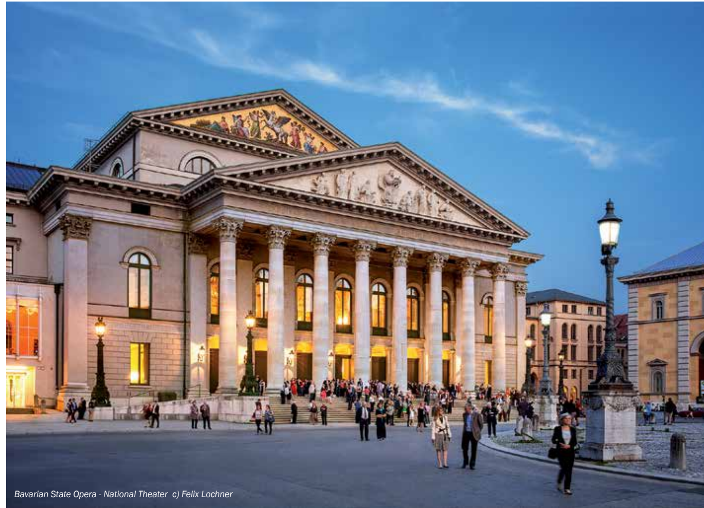
Bavarian State Opera - National Theater

إننا سعداء بالترحيب بكم في مدينتنا الرائعة ونتمنى لكم إقامة هنيئة وممتعة. مع خالص التحيات جيرالدين كنودسون