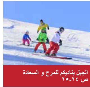
الجيل بناديكم للمرح والسعادة ص ٢٤-٢٥