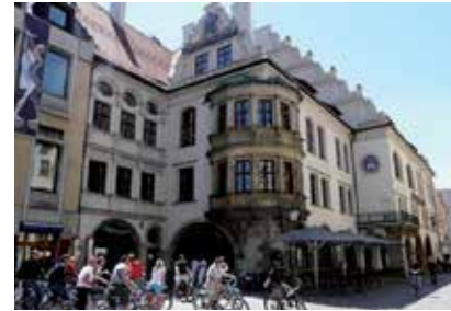
هوف بروي هاوس

يشمخ في وسط المدينة مبنى البلدية بأسلوب بنائه الغوطي الجديد. إنه مكان مفضل لمحبي النقاط الصور بما يضمه من لعبة الأجراس الشهيرة عالمياً التي تدور بشكل إضافي في الفترة ما بين الساعة ١١ - ١٢ يومياً وكذلك في الساعة الخامسة مساءً من شهر مارس إلى أكتوبر وتجذب إليها بذلك كل الأنظار.