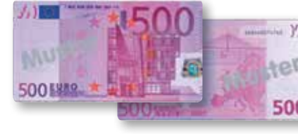
خمسة مائة يورو