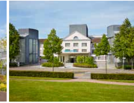
مستشفى هيرسلاندين في زيورخ hirslanden.com

يقع المستشفى في أفضل موقع مرتفع مع إطلالة على البحيرة. مع وجود ٢٥٠ من الأطباء المحالين، يقدم المستشفى الراسخ مجموعة من الخدمات الطبية القائمة على أحدث التقنيات وطرق العلاج.