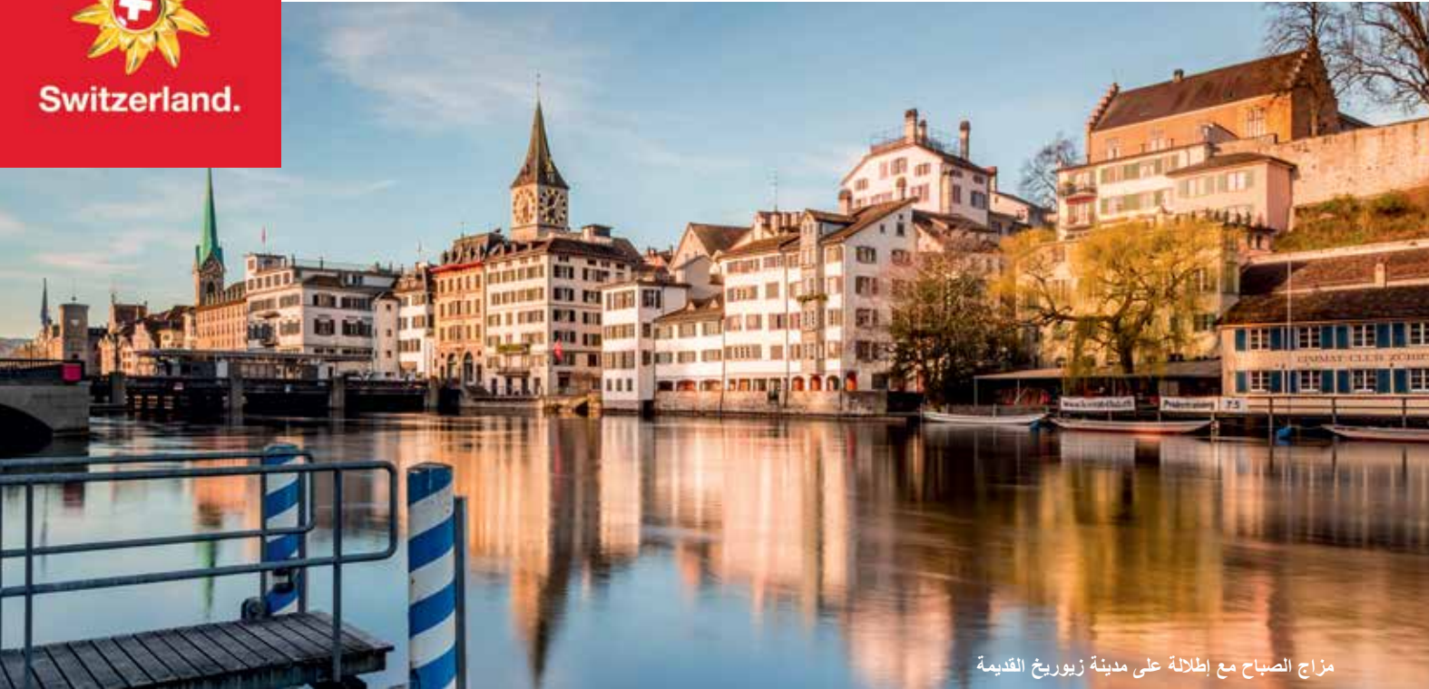
مزاج الصباح مع إطلالة على مدينة زيورخ القديمة