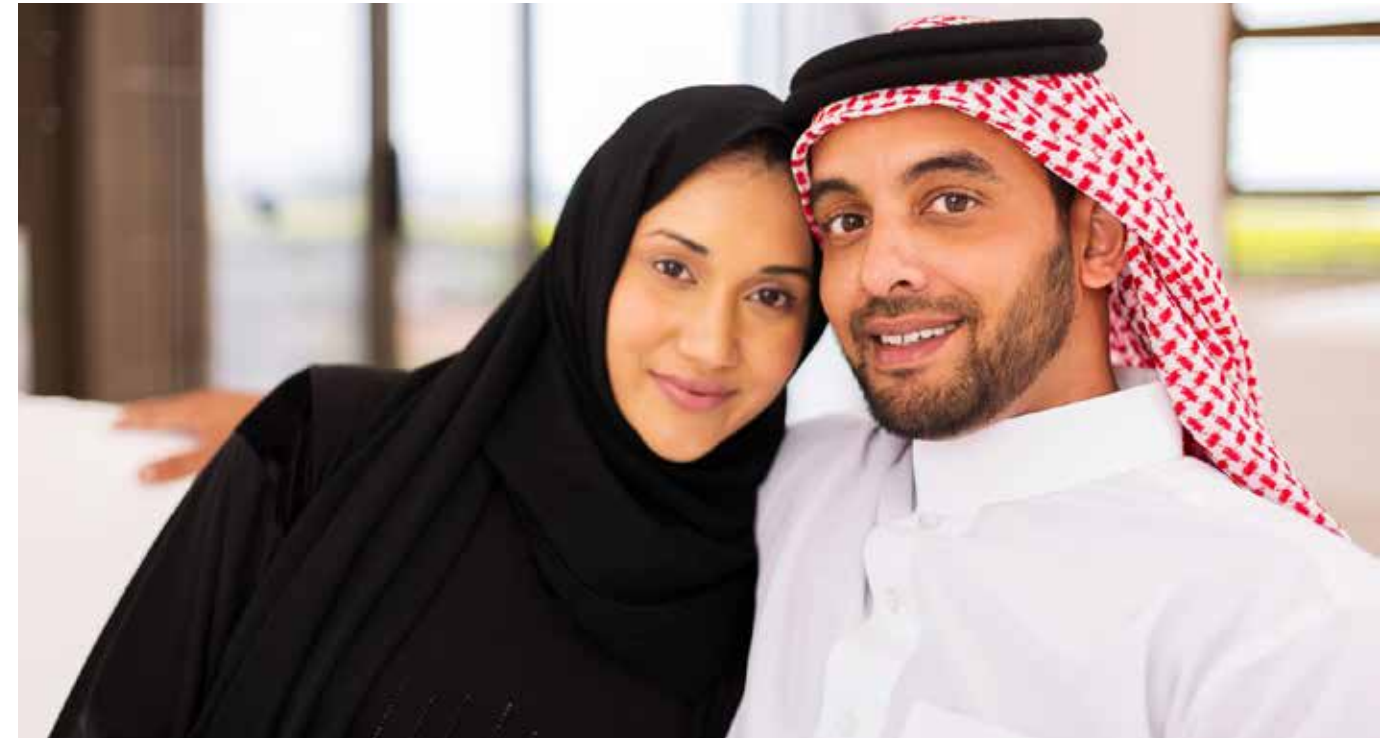
قضاء شهر العسل

لمزيد من المعلومات: 089-30669222 book@honeymoonmunic.com