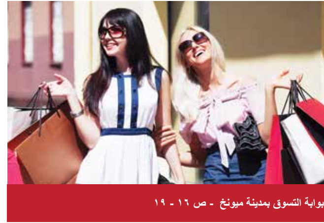
بوابة التسوق بمدينة ميونخ - ص ١٦ - ١٩

قاموس، هواتف هامة، الطوارئ، المواصلات العامة: الباص، القطار، قطار الأنفاق، قطار الجسور، التاكسي، قطار المترو، حركة مطار ميونخ، إجراءات التأشيرة، مواعيد الإفتتاح، القياسات والأوزان والأبعاد، العملات، ماستر كارد، فيزا كارت، أميريكان اكسبرس، الطقس والمناخ، www.oanda.com الخرائط والرسوم، الأكل والشرب، المساجد، أوقات الصلاة، معلومات سياحية، السيارات والدراجات النارية، المتاحف، التأشيرات، جواز السفر، الرسوم، قيادة السيارات في ألمانيا، الصيدليات، المتاحف، بيانات الناشر وغيرها.