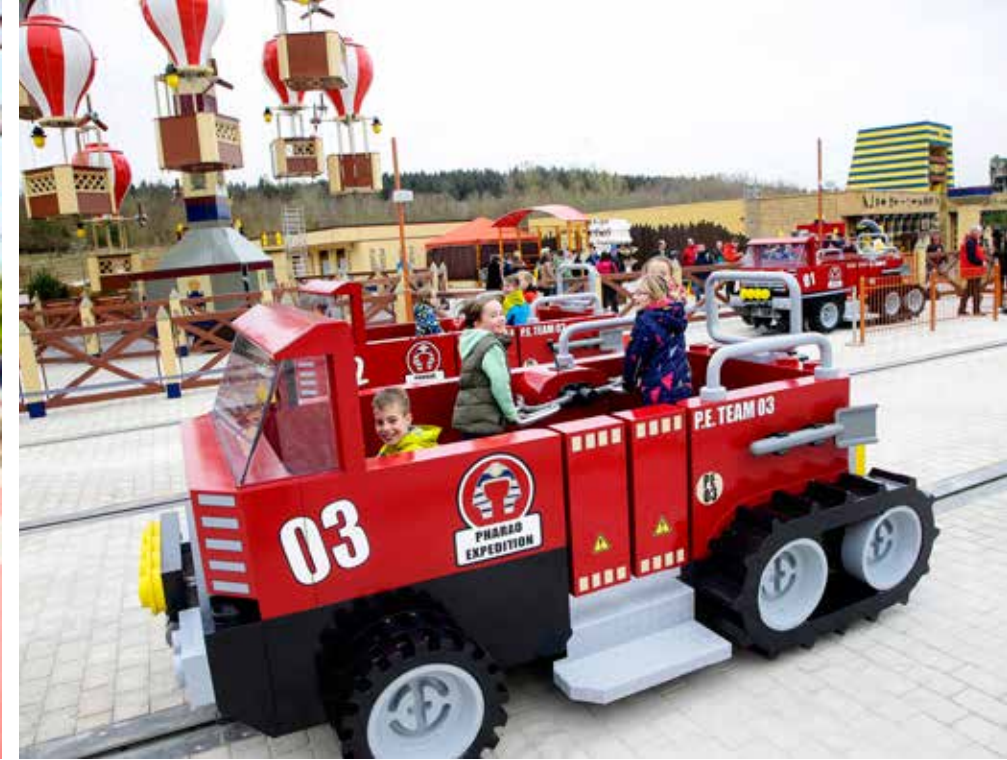
العوالم الجذابة في ليجو لاند

الأحداث والإثارة. ومن أحب أن يقضي ليلته كفارس أو أميرة يمكنه ابتداءاً من موسم ٢٠١٣ أن يبيت في قرية الإجازات ويختار أحد ٣٤ غرفة خلابة في القلعة الجديدة في ليجولاند صنفت حسب المواضيع المختلفة.