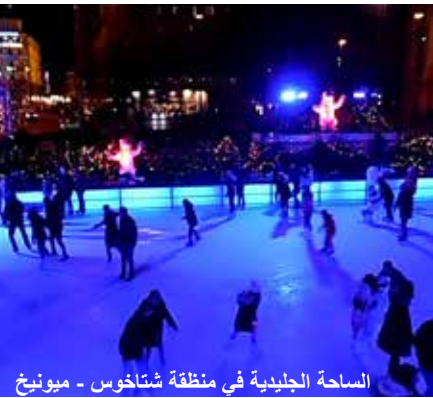
الساحة الجليدية في منطقة شتاخوص - ميونخ