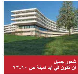
شعور جميل أن تكون في أيد أمينة ص ٦٠-٦٣