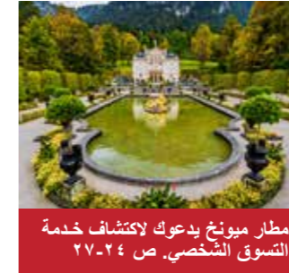
مطار ميونخ يدعو لاكتشاف خدمة التسوق الشخصي. ص ٢٤-٢٧