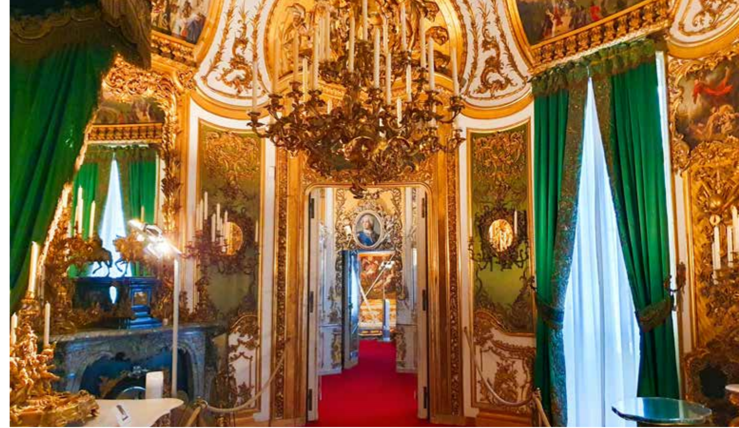
بنيت خصيصاً للموسيقار ريشارد فاغنر: كهف الزهرة - كهف صناعي من الحجار الكلسية