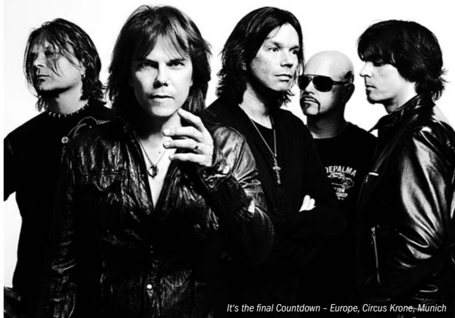
It's the final Countdown - Europe, Circus Krone, Munich

٥٠ سنتا Cent 50 ٢٤ أكتوبر ٢٠٢٣، الساعة ٨:٠٠ مساءً، القاعة الأولمبية