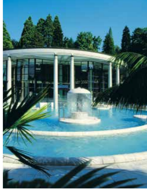
منتجع كاراكالا الحديث