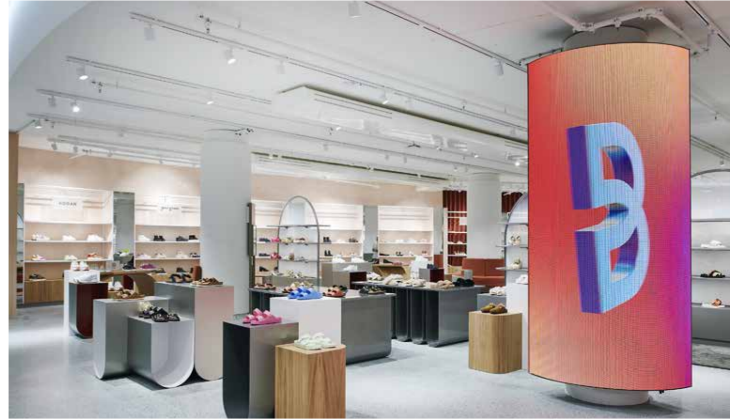
... مجموعة متنوعة ملهمة من العلامات التجارية التي لا تترك أي شيء مرغوباً فيه.