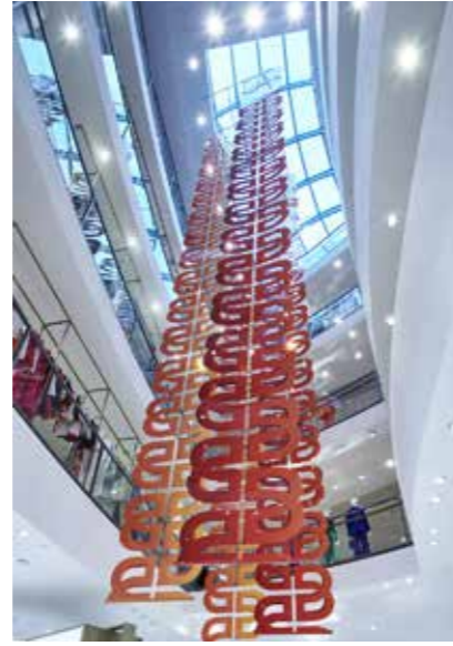
بالصور: مناطق تسوق حصرية موزعة على ٦ طوابق..