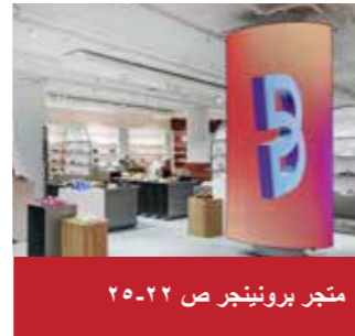
متجر برونيجر ص ٢٢-٢٥