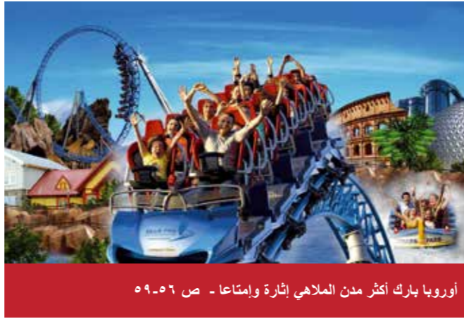
أوروبا بارك أكثر مدن الملاهي إثارة وإمتاعا - ص ٥٦-٥٩

CityDent Munich Praxis für Zahnheilkunde Zahnarzt Msc Adnan Darwish Bayerstrasse 27 80335 Munich - Germany هاتف: +49 (0) 89 593 575 فاكس: +49 (0) 89 545 40 786 البريد الإلكتروني: info@citydent-munich.com www.citydent-munich.com