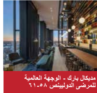
مديكال بارك - الوجهة العالمية للمرضى الدوليين ص ٥٨-٦١