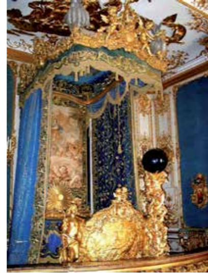
يميناً: غرفة النوم والسرير ومنظر داخلي للبيت المغربي