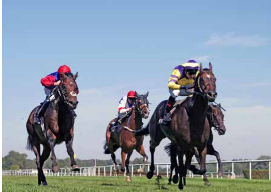
أقدم كازينو في ألمانيا، حيث يختتم يوم بديع تلفه أجواء اللعب ويستهوئ زوارا من جميع أنحاء العالم