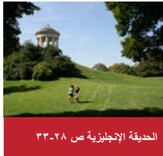
الحديقة الإنجليزية ص ٢٨-٣٣