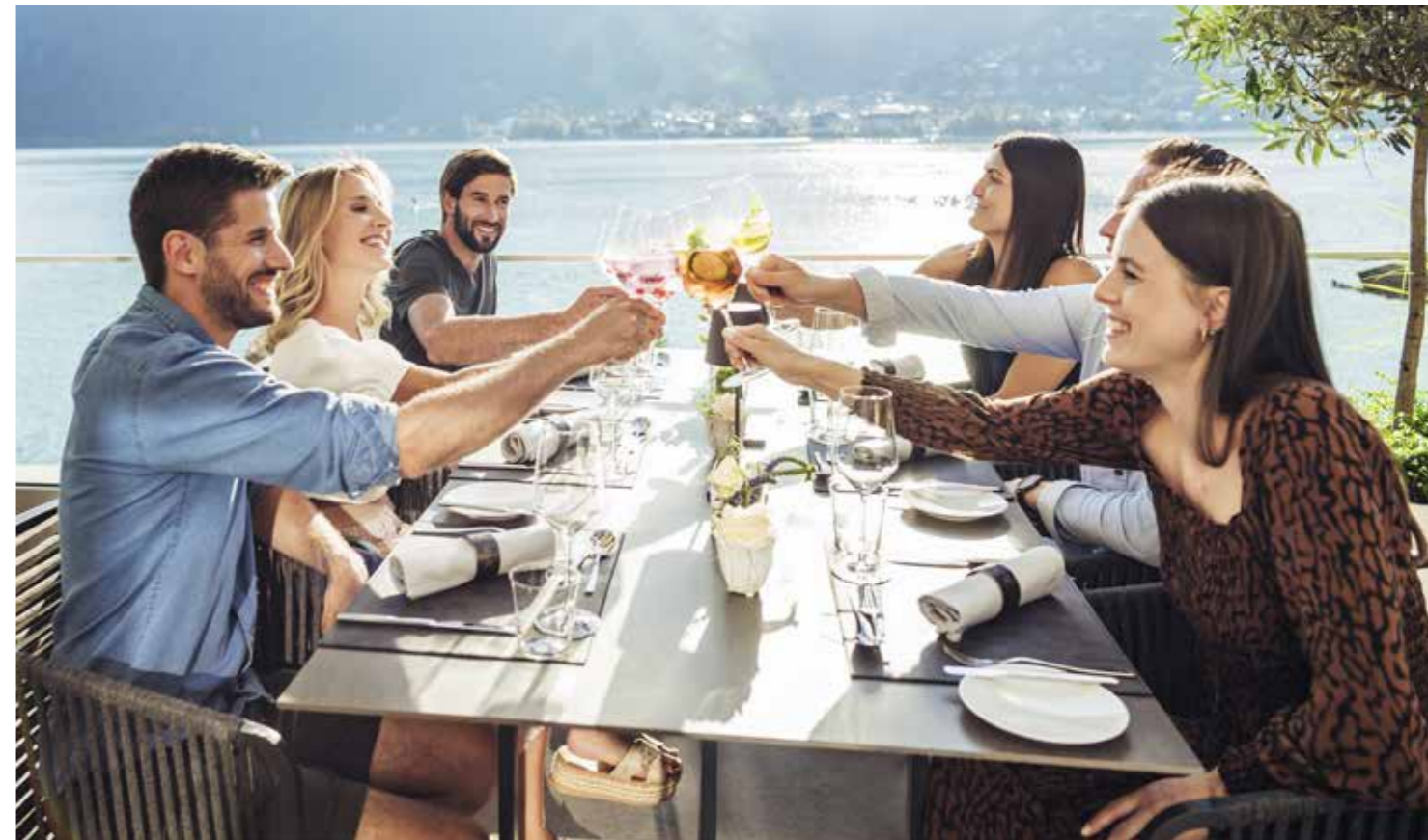
على ضفاف قمم الجبال متعة حقيقية لكافة أفراد العائلة.

وتجد العائلات كل ما تصبو إليه في حمامات الشاطئ الثلاث المحيطة بالبحيرة وكذا في المسبح المغلق في مجمع اللهو في بحيرة تسيل. أما عشاق المغامرات فليهم أن يستعدوا لتسارع النبض خلال قيامهم