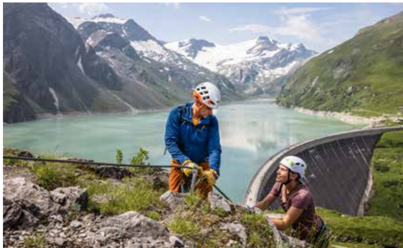
تبعاً لطبيعة اللياقة الرياضية يمكن الوصول لقمم الجبال إما على الأقدام أو بركوب العربات المعلقة.

قمم وجبال وبحيرات – تجمع تسيل على بحيرة كابرون بين كافة جوانب الألب الجمالية لتكون محطة سياحية نمساوية على مدار العام