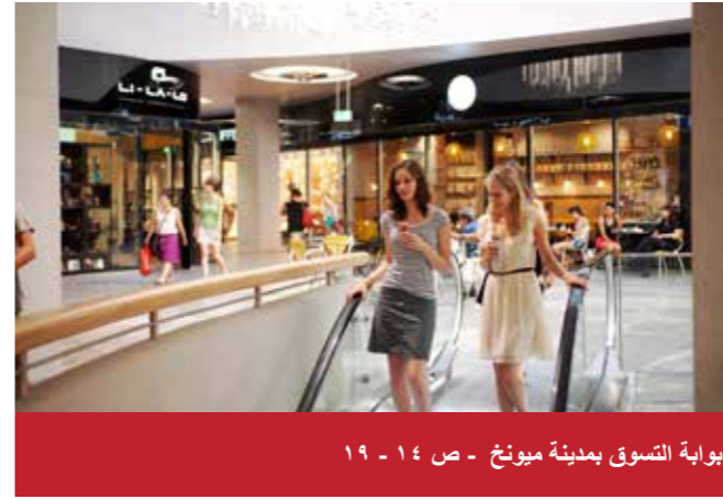
بوابة التسوق بمدينة ميونخ - ص ١٤ - ١٩

قاموس، هواتف هامة، الطواريء، المواصلات العامة: الباص، القطار، قطار الأنفاق، قطار الجسور، التاكسي، قطار المترو، حركة مطار ميونخ، إجراءات التأشيرة، مواعيد الإفتتاح، القياسات والأوزان والأبعاد، العملات، ماستر كارد، فيزا كارت، أميريكان اكسبرس، الطقس والمناخ، www.oanda.com الخرائط والرسوم، الأكل والشرب، المساجد، أوقات الصلاة، معلومات سياحية، السيارات والدراجات النارية، المتاحف، التأشيرات، جواز السفر، الرسوم، قيادة السيارات في ألمانيا، الصيدليات، المتاحف، بيانات الناشر وغيرها.