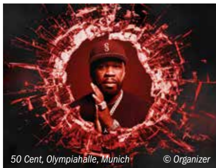
50 Cent, Olympiahalle, Munich

جولة Legacy Tour ٢٠٢٣ - تأتي الفرقة البريطانية الناجحة إلى ألمانيا مرة أخرى بسبب الطلب الكبير من المعجبين: أغاني مثل "If You Think You Know" و "How To Love Me" و "Don't Play Your