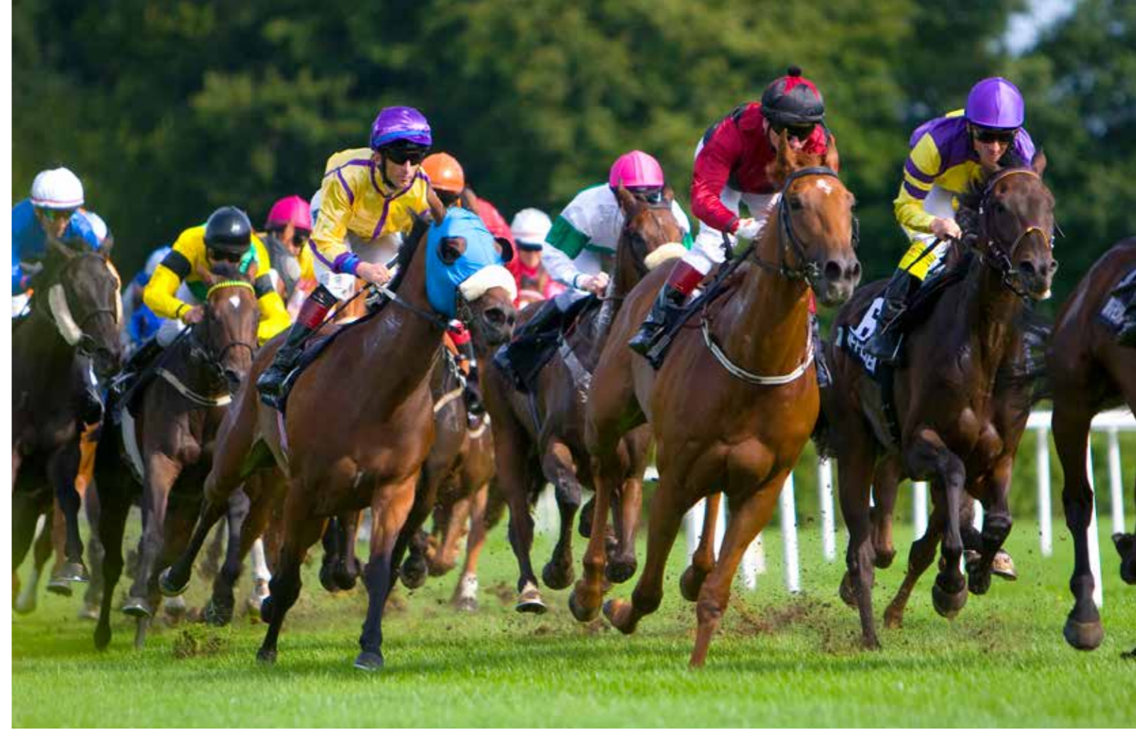
منذ ١٨٥٨ تلتقي نخبة «متسابقي الخيول» ثلاث مرات في السنة وتقضي أسبوعا لإجراء سباق الخيل